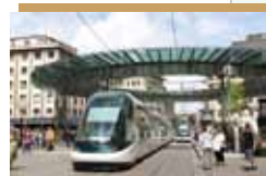
ストラスブール(フランス)